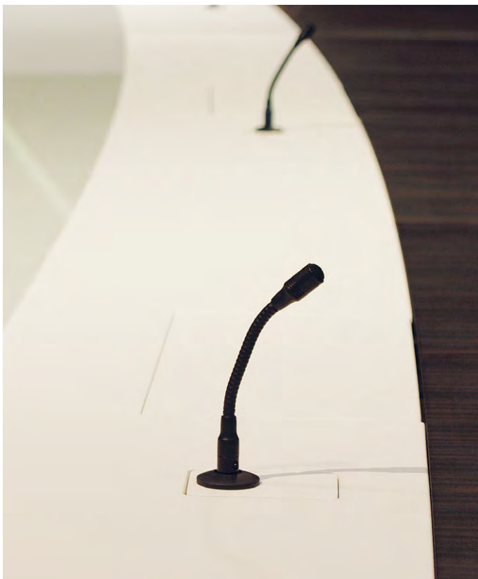
Foto: OEM-Version Mikrofonlift beyerdynamic Mikrofon