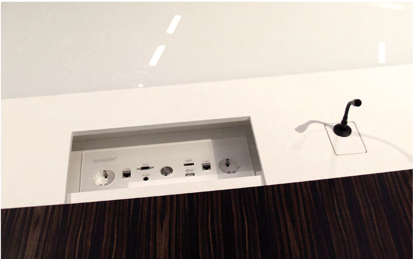
Foto: OEM-Version Mikrofonlift beyerdynamic Mikrofon