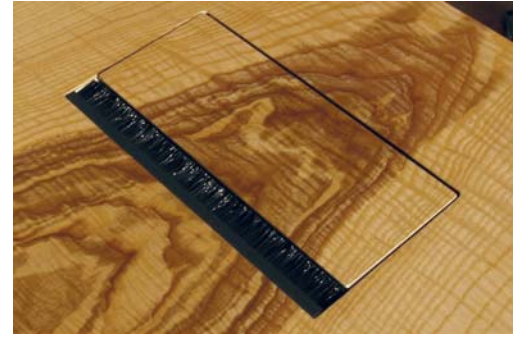
Anschlussfeld mit durchlaufendem Furnier