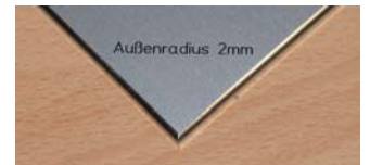
Außenradius 2mm mit R5