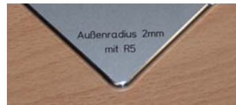
Außenradius 2mm mit R5