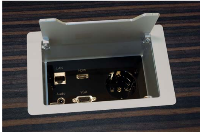
Design Variante flächenbündig eingelassen

Edel abgerundet wird das Anschlussfeld in der Design Variante. Hier besteht die frei definierbare, flächenbündige Platte aus Plexiglas, die individuell beschriftet werden kann.