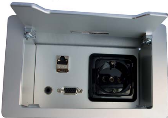
Blick ins Innere der Standard+ Variante mit definierter Bestückung und Standardoberfläche

Internationale Steckdosen sind auf Anfrage lieferbar.